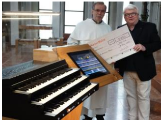
Spendenübergabe am 2. Spieltisch

Erst lange nach der Weihe der wiedererbauten Kirche St. Bonifaz (1954), konnte das ursprüngliche Konzept der Orgelbaufirma Oberlinger für die neue Orgel in St. Bonifaz über mehrere Etappen (1957, 1971, 1989) verwirklicht werden. Allerdings zeigten im Laufe des vergangenen Jahrzehnts diverse Funktionen/Materialien der Orgel massive Verschleißerscheinungen und: zwischenzeitlich hatten sich auch die Ansprüche an Klangfarbe und -qualität geändert. Die Pfarrei hatte deshalb 2017 mit ihrem Sanierungsauftrag an die Firma Freiburger Orgelbau wichtige Vorgaben für die technische Erneuerung, für Funktionalität und – im Diskurs mit den Orgelbauern – für klangliche Erweiterungen formuliert.